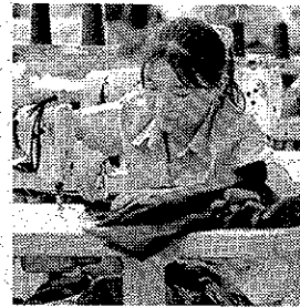
Operaie tessili al lavoro nelle fabbriche cinesi