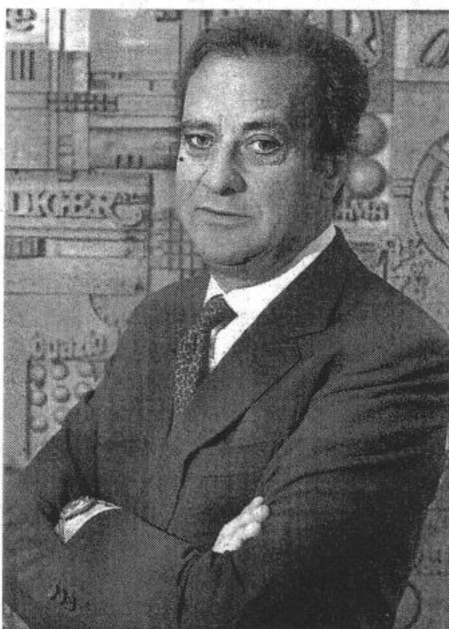
Debutta sull'Expandi mercoledì 9 la Tamburi investment partners guidata da Giovanni Tamburi

Banca Intesa e Pambianco organizzano un convegno a Milano, dal titolo «Rinnovare il modello di successo del Made in Italy».